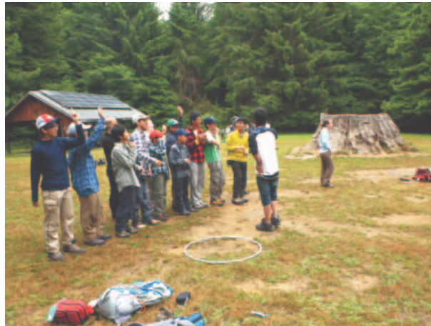
チーム作りは大切