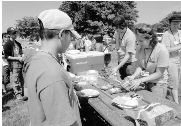
ご飯の準備。お腹すいた～