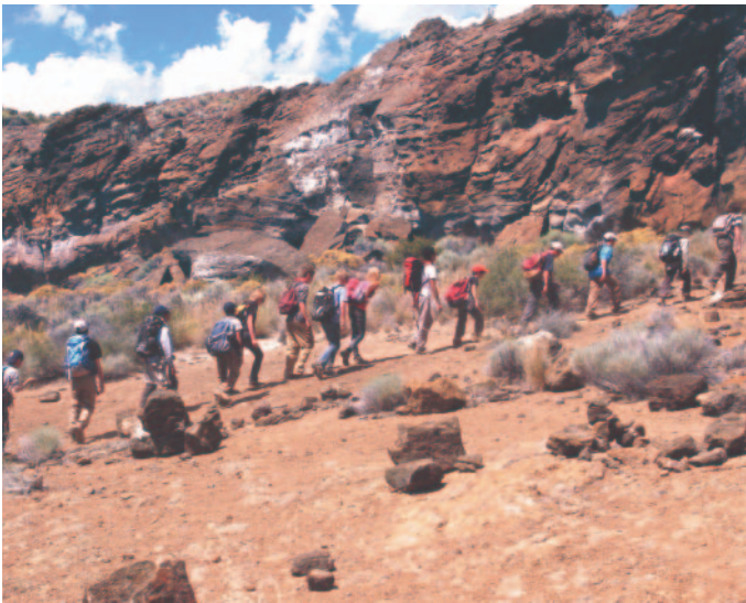
仲間とともに、自らの足で雄大な自然に行く！

アメリカ・オレゴン州は約650kmにわたって続く海岸線と自然豊かな峡谷と緑の平原、さらに東にはカスケード山脈、3,450mのMount Hoodがそびえ、変化に富んだ、全米でも有数の自然の宝庫です。自然を感じ、自然に学び、自然のなかで生活するスキルを学ぶ最良の環境のもとで、オレゴン国際キャンプは1997年より開始されました。