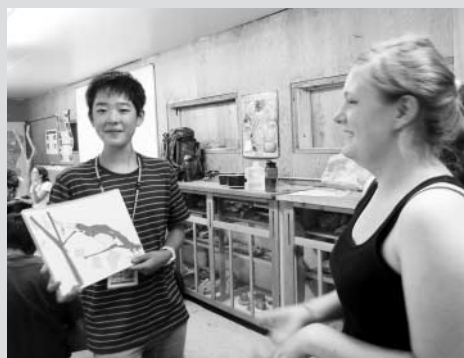
素語りを披露中。事前活動で培った力は、オレゴンキャンプでも存分に発揮できます。