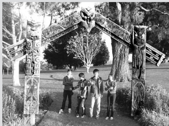
マオリの門で、ホストファミリーと記念撮影。晩秋のきれいな風景でした。

※通学に関しては、原則としてホストと同一の学校となりますが、各学校の受入れ人数やホストとの年齢差などにより、ホストとは異なる学校を訪問する場合があります。