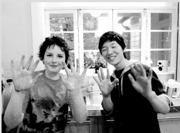
ホストファミリーと楽しくカップケーキ作り。ケーキの上には、ラグビーボールのお菓子も作ってのせました。

はじめの時は言いたいことは伝わらないし言っていることも分からないし帰りたいたしか思ってた。でも、学校のクラスのみんなはラグビーやおにごっこに誘ってくれたし、ホストファミリーは簡単な英語で話してくれるし、ニュージーランドが楽しいと思えるようになった。単語と絵とジェスチャーを使って伝えたいことを伝えられたし、英語が分からなくても相手の話を理解しようとしたら良いと感じた。