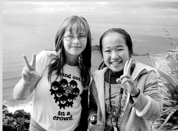
ホストファミリーと一緒に、MAUAO山へ出かけました。とっても楽しかったです。