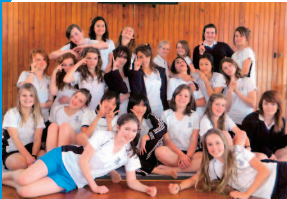
P.E. (体育) の授業中の一コマ。

私たちの住む地球のうえには多様な文化が存在しています。多様な文化に触れることは多様な価値観を知ることにつながり、より広い視野でものごとを考え行動することができるようになります。今、私たち一人一人は地球市民としてお互いを尊重し、理解しあいながら生きていくことが求められています。