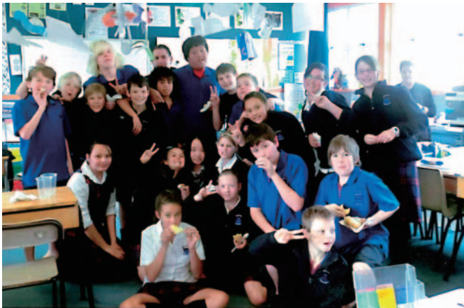
クラスみんな、 すばらしい時間を ありがとう！ 頑張ってるみんなの 名前を覚えてよ。

Enjoy your homestay and school life in New Zealand