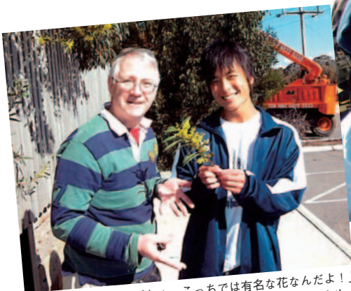
「きれいなお花でしょ。こっちは有名な花なんだよ！」 by host father