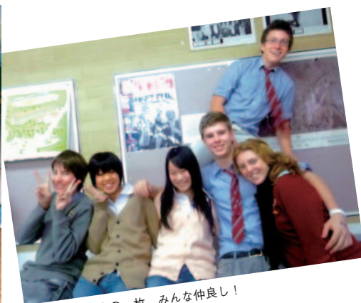
ホームルーム中の一枚。みんな仲良し！