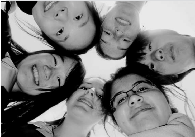
自然とできた友達の輪。Japaneseの授業での、カレー作り班にて。

学校を歩くたびに友達が手を振ってくれたり、別れるときは「I miss you」と言ってくれてハグしたり、たくさんの友達ができてうれしかったです。中でも「You are a new best friend」と言われたときは本当にうれしかったです。ホストマザーが「あなたをここにkeepして子ども3人を日本に送りたい」と言ってくれたときは、ジョークだけどそれを言ってくれるホストファミリーに出会えてよかったと思いました。