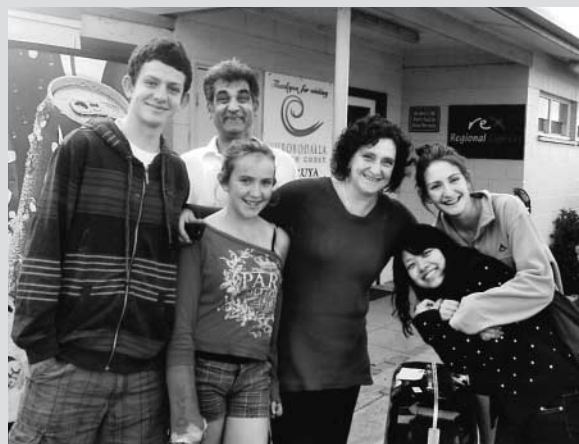
ホストファミリーと別れる前に撮った最後の一枚。 ありがとう!また必ず会おうね! Thank you my family!