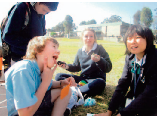
楽しいrecess(休み時間)は1日2回。お菓子を食べたり、ふざけあったり……。日本の遊びを教えてあげたらみんな喜んでくれた。