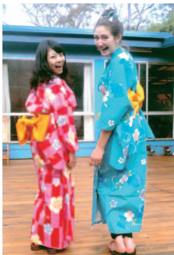
ホームステイ1日目。ホストと一緒にゆかたを着た！すっごく喜んでくれた！！

私たちの住む地球のうえには多様な文化が存在しています。多様な文化に触れることは多様な価値観を知ることにつながり、より広い視野でものごとを考え行動することができるようになります。今、私たち一人ひとり地球市民としてお互いを尊重し、理解しあいながら生きていくことが求められています。